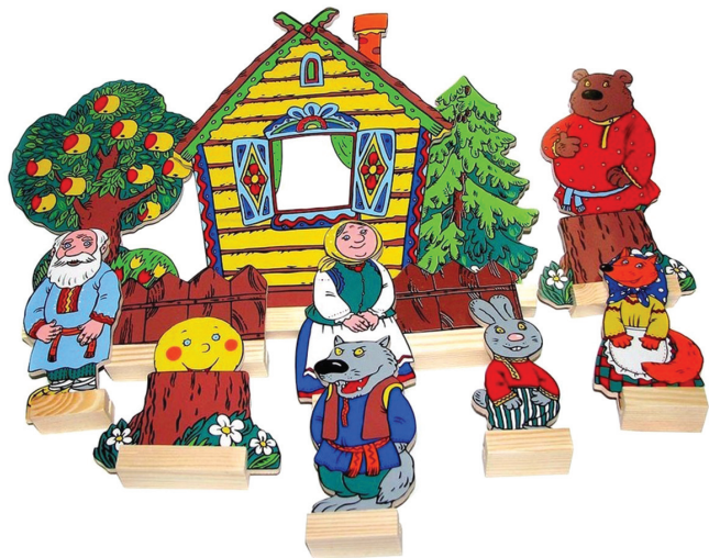
Настольный театр картинок

2. В настольном театре картинок используемые персонажи и декорации – картинки. Чтобы они были устойчивыми и без труда передвигались, картинкам делают подставки. Движения героев должны совпадать с текстом. Состояние действующих лиц, их настроение передаётся интонацией играющего. Персонажи появляются по ходу действия, что создаёт элемент сюрприза, вызывает интерес детей.