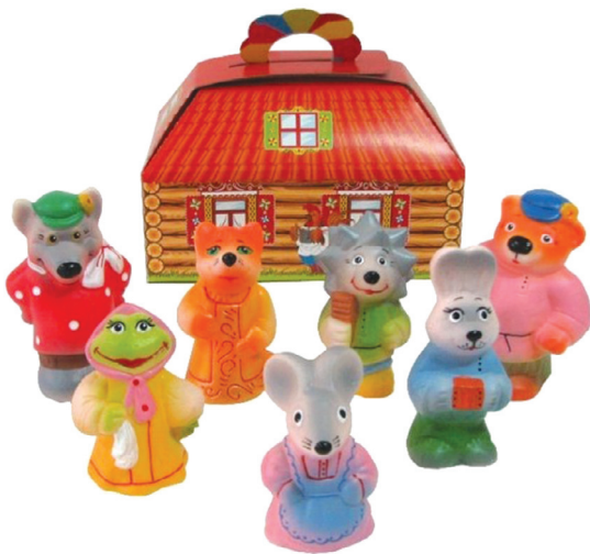
Настольный театр игрушек